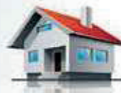
Vergleich der Betriebskosten

*Schallleistungspegel für STRATON® S17 (Teillast/Volllast).