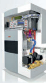
THISION® S DUO mit zusätzlichem Mischkreis