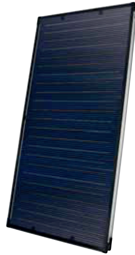
SOLATRON S 2.5 V (vertikal)

Der Schlüssel für die optimale Warmwasserbereitung und Heizungsunterstützung mit Hilfe der Sonne liegt in der perfekten Abstimmung der Komponenten. ELCO bietet Ihnen komplette Solarsysteme. Dazu zählen Solar-, Brauchwasser- und Pufferspeicher in vielen verschiedenen Größen für eine optimale Auslegung der Solaranlage an Ihre Anforderungen. Pufferspeicher können die erzeugte Wärme über längere Zeiträume speichern. Solarregler sorgen dafür, dass die auf dem Dach gewonnene Wärme so effektiv wie möglich genutzt werden kann. Dazu kommt eine spezielle ELCO Pumpengruppe als Basis- und Kaskadenmodul.