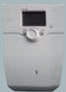
Solarregler LOGON B SOL