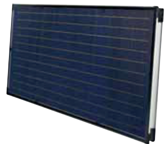
SOLATRON S 2.5 H (horizontal)